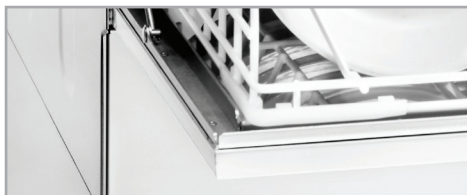
Porte double paroi

Stainless steel washing and rinsing arms