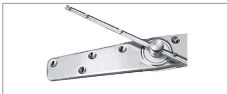
Bras de lavage et de rinçage en inox

Stainless steel washing and rinsing arms