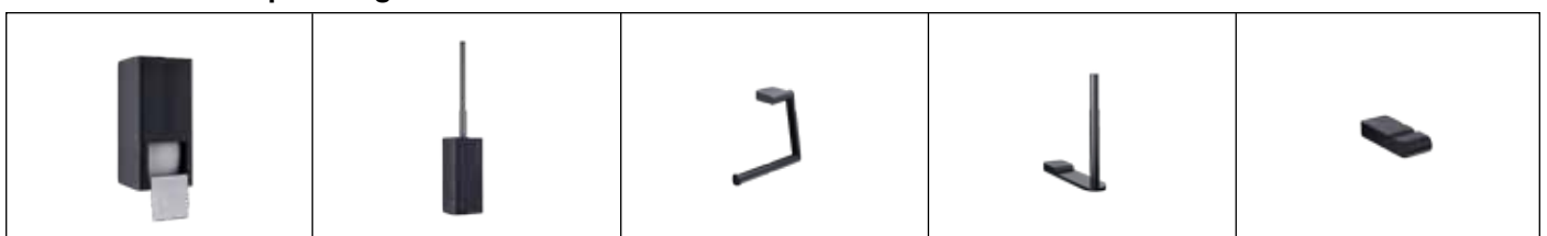
dopp. WC-Rollenhalter DP-300